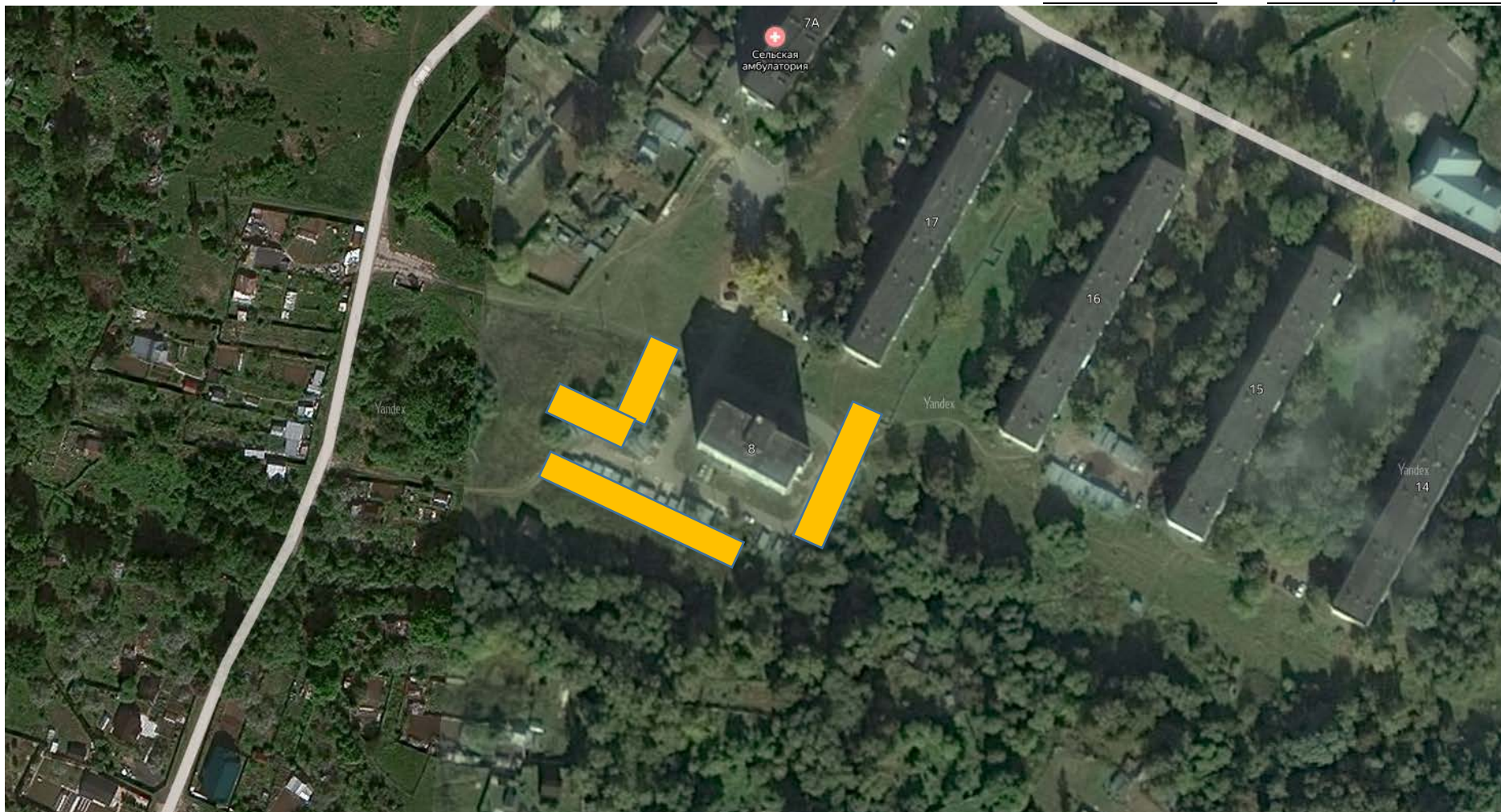
г.о. Чехов, с. Троицкое, за домом 8